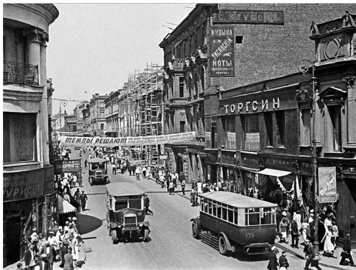
Торгсин в довоенной Москве. Фото 1930-х годов

бы одна золотинка блеснула... Поневоле согласишься, что все дело — в петушином слове».