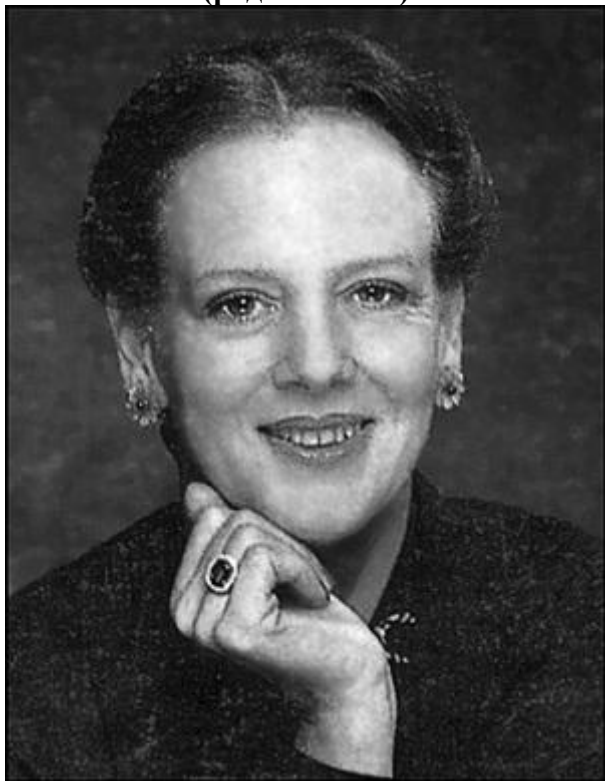
Королева Дании с 1972 г.

Полное имя — Маргрете Александрина Торхильдур Ингрид (род. в 1940 г.)