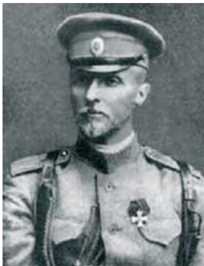
Генерал Павло Скоропадський, командир Українського корпусу, 1917 р.

з'їзді в Чигирині обраний отаманом Вільного козацтва. Взяв участь у війні з більшовиками, зокрема в боях проти 2-го гвардійського корпусу.