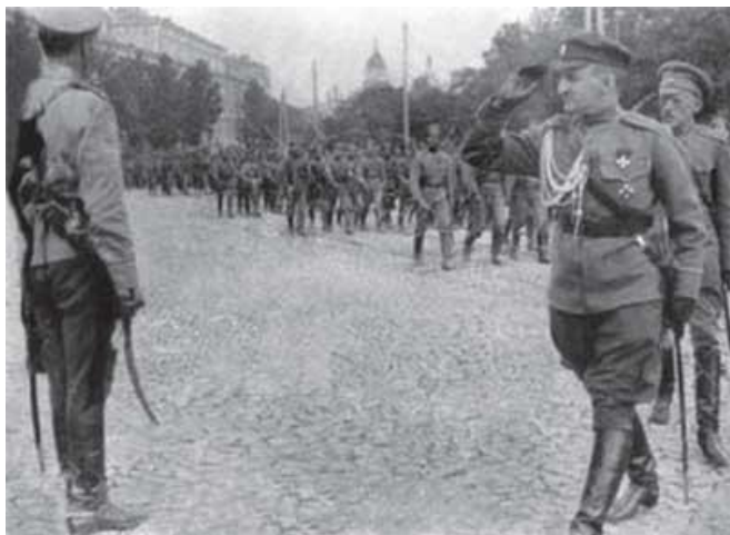
Парад українських частин у Києві.

Увечері 24 квітня в будинку Бродського на Єкатерининській вулиці, де розмістилося командування німецьких збройних сил в Україні, генерал Гренер представив Скоропадському проект угоди між ними. 35