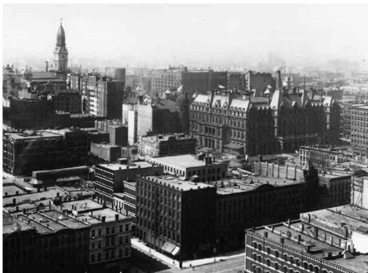
Чикаго, приблизно 1889 рік