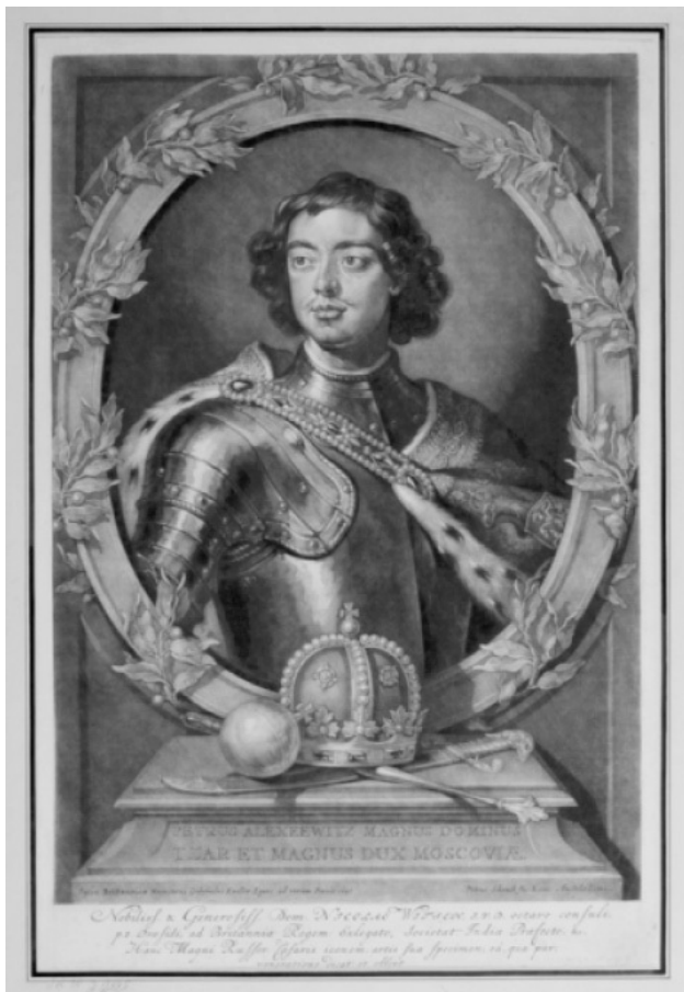
Худ. Годфри Неллер; гравер П. Шенк Портрет Петра I