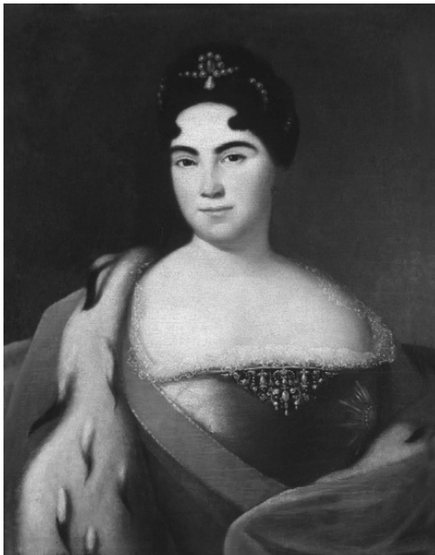
Неизвестный художник Портрет Екатерины I

Первая четверть XVIII в. Холст, масло. Государственный Эрмитаж, Санкт-Петербург.