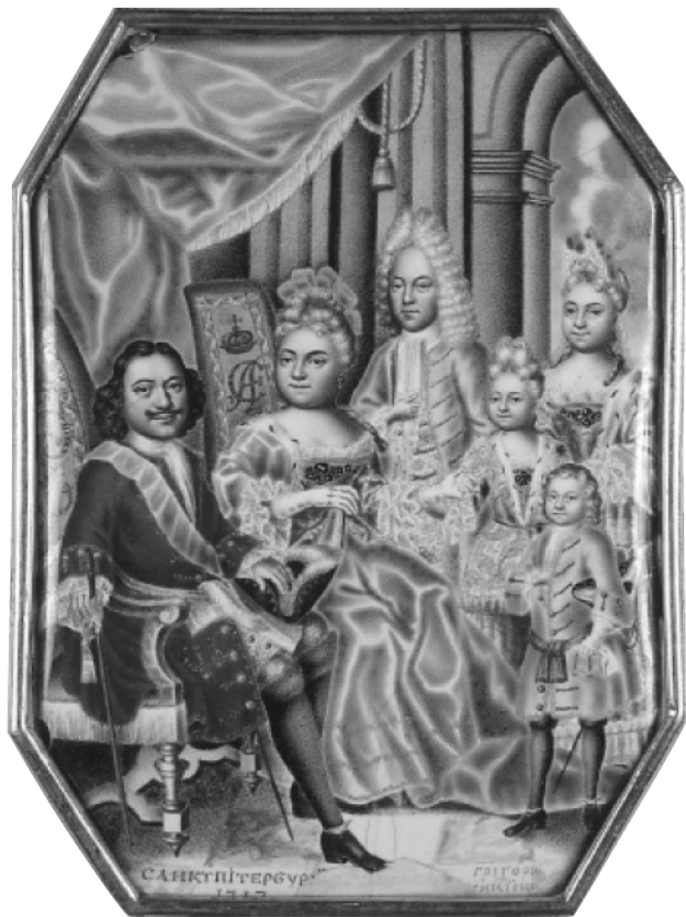
Музыкайский Григорий Семенович Миниатюра на эмали: Портрет семьи Петра I. Царевич Алексей стоит в центре рядом с Екатериной Алексеевной