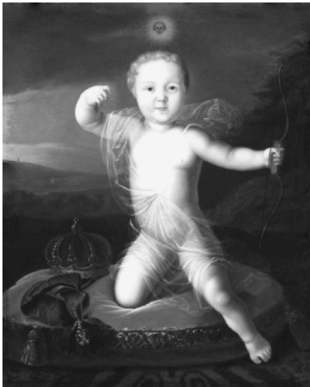
Луи (Людовик) Каравакк Портрет царевича Петра Петровича в виде Купидона

1716 (?). Холст, масло. Государственная Третьяковская галерея, Москва.