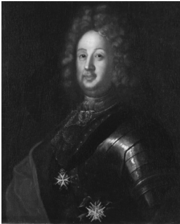
Аргунов Иван Петрович. Портрет фельдмаршала графа Бориса Петровича Шереметева

Ок. 1750 г. Холст, масло. Государственный Эрмитаж, Санкт-Петербург.